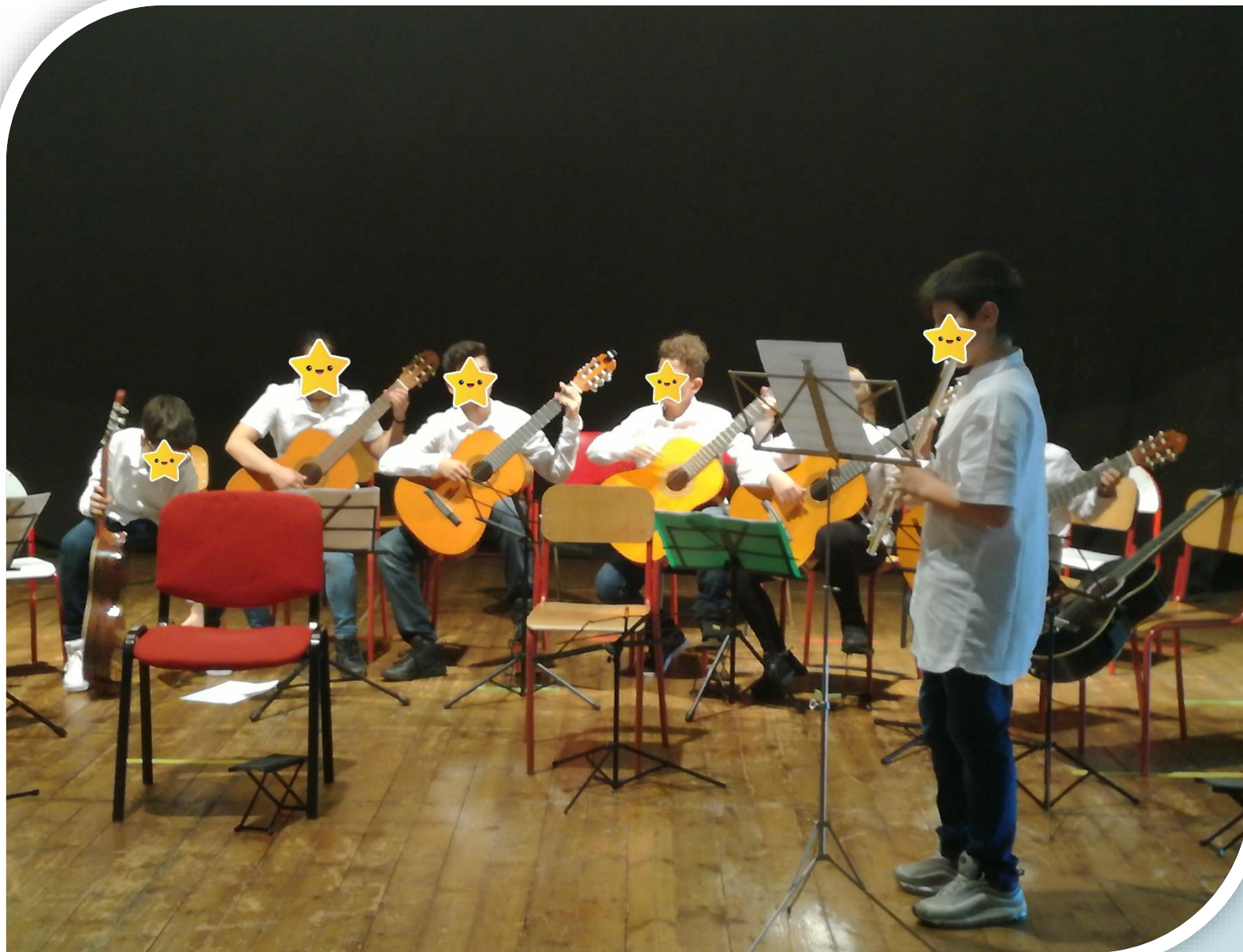
Sezione musicale: prove d'orchestra