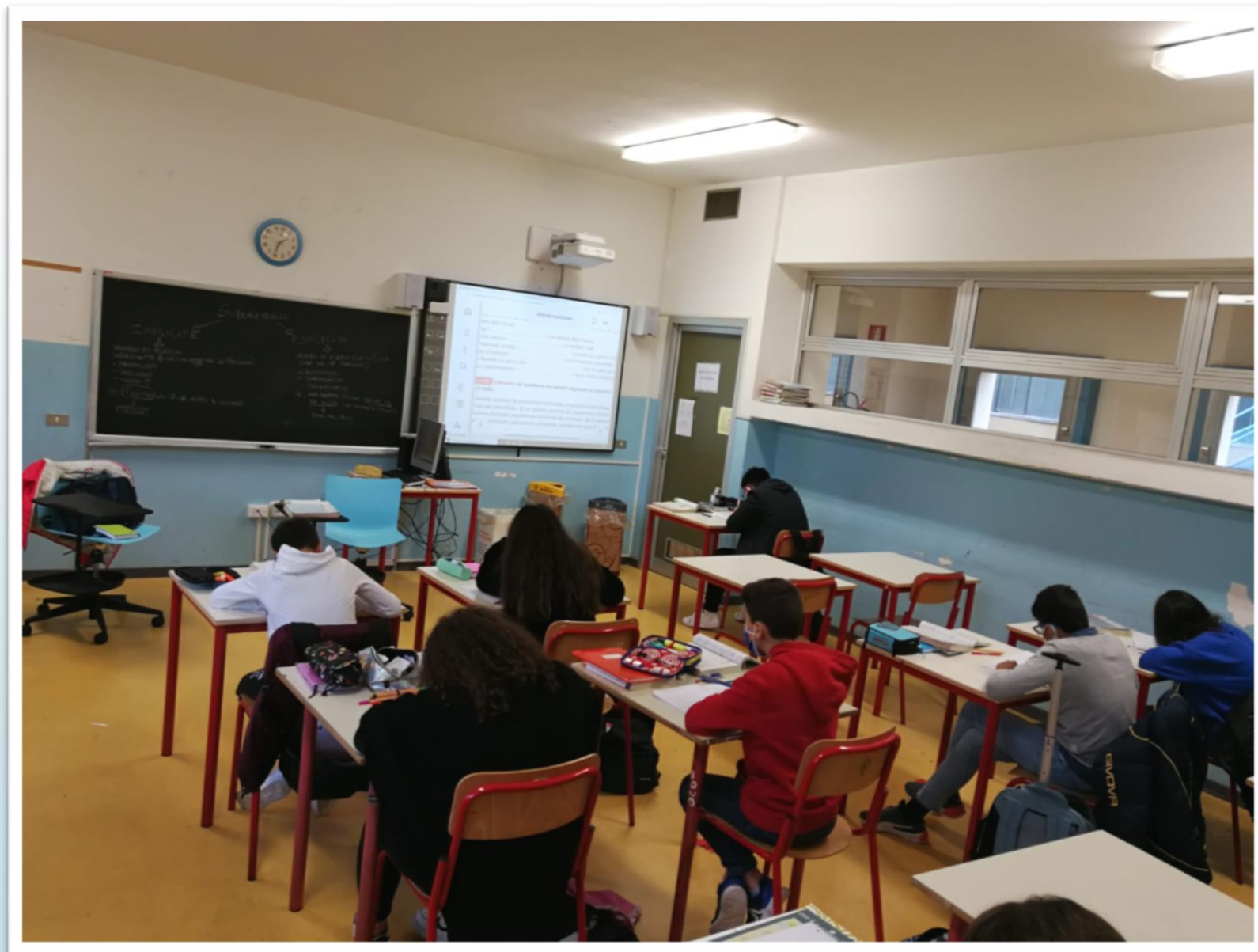
Tipologia di aula e alunni durante una lezione