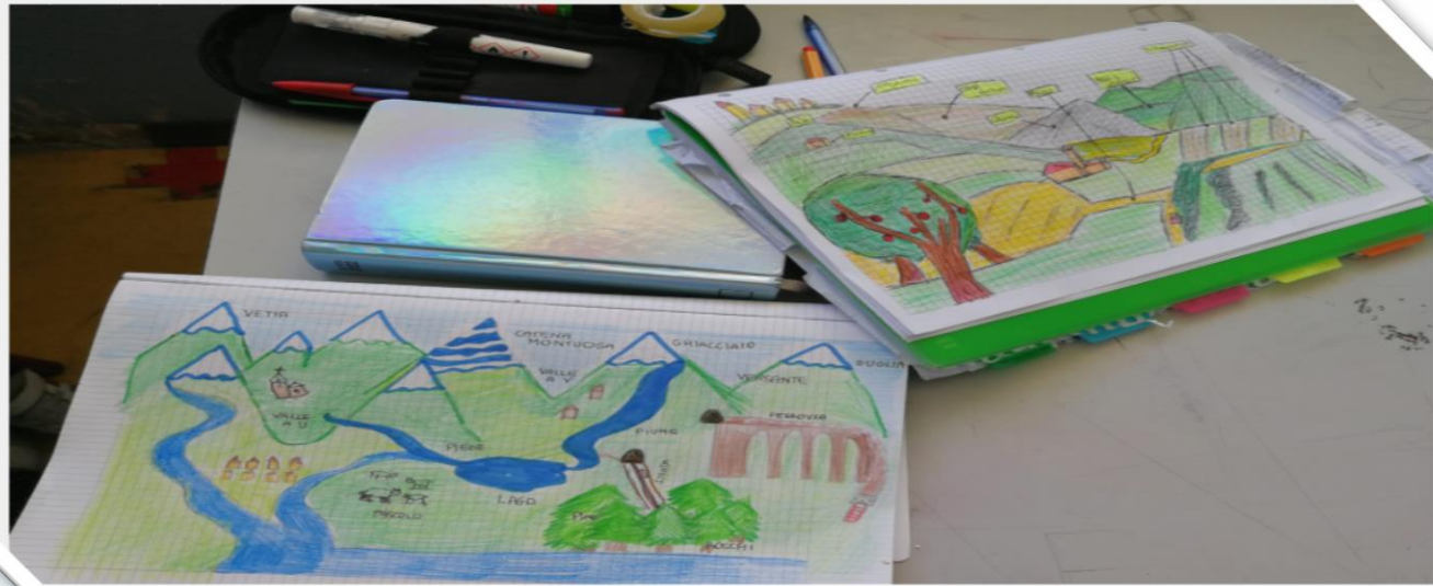
Alcuni compiti di geografia