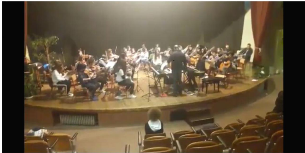
Sezione musicale: prove d'orchestra

Saggio finale del corso musicale presso il Teatro Cristallo a.s. 2018-2019